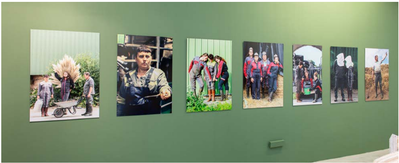
Damien Rouxel, série de photographies, format variable, entre 2017 et 2020.

- Art history challenge. Dans cet atelier, les élèves seront invités à s'inspirer du travail de Damien Rouxel. Jeune artiste fils d'agriculteurs, il met en scène sa famille et leur ferme dans des compositions qui rejouent des œuvres d'art anciennes.