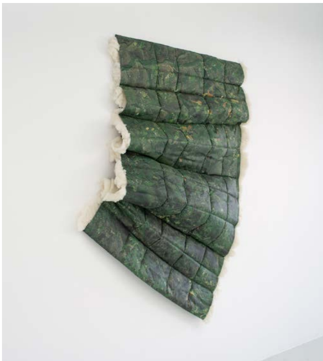
Morgane Denzler, Remembrement , impression numérique sur tissu matelassé, laine de mouton nappée, 150 x 220 cm, 2018

Aussi, en prenant appui sur le travail de Damien Rouxel et de peintures anciennes représentant le monde agricole, les élèves s'amuseront à imiter des postures, à incarner les divers paysans et paysannes représentés. Quels gestes faisaient ou font partie de leur quotidien ? Observation, imagination et débrouillardise seront de mise pour imiter aux mieux les peintures en s'aidant d'accessoires divers. Leurs imitations seront immortalisées en photographies.