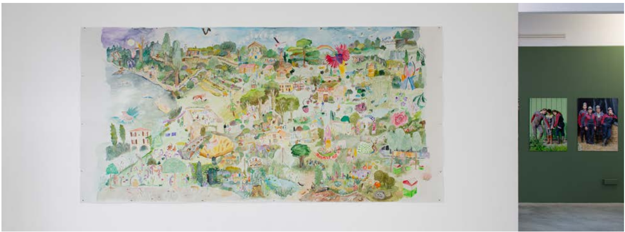
Le Nouveau Ministère de l'Agriculture, Aux arbres ! Ecotopie du Nouveau Ministère de l'agriculture pour une stimulation des processus vitaux post néconomie, préalable à la plantation d'une forêt nourricière à Négrepelisse , Aquarelle, 300 x 150 cm, 2020. ©Margot Montigny

- Imagine ta ville idéale : cet atelier se base sur une aquarelle du Nouveau Ministère de l'Agriculture dans laquelle les deux artistes, Stéphanie Sagot et Suzanne Husky, repensent la ville de Négrepelisse pour en faire une utopie écologique.