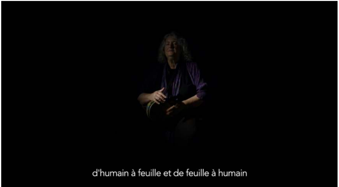
Image tirée de la vidéo.

Lien youtube : https://www.youtube.com/watch?v=5p0La0yvGCg