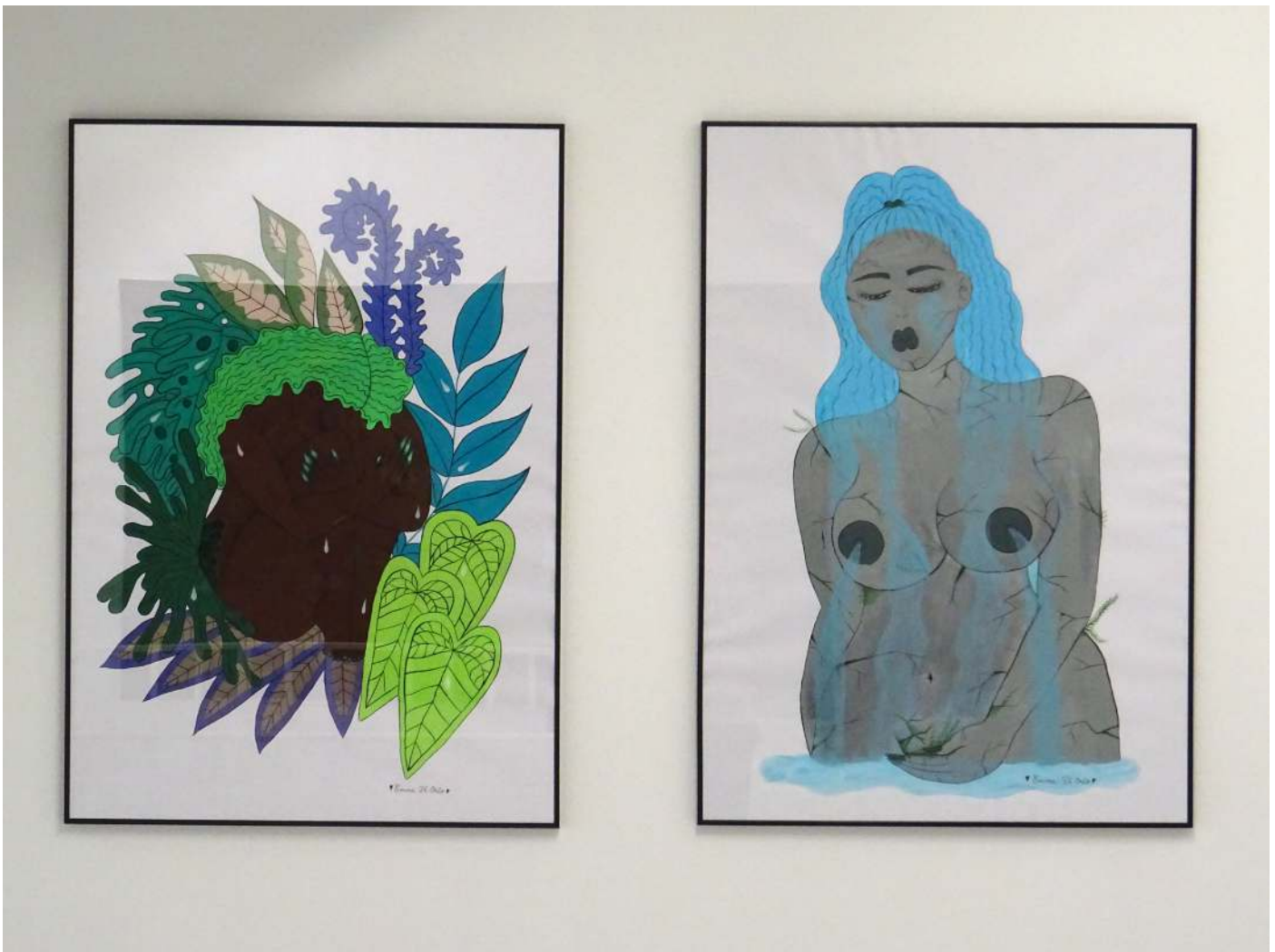
« Forest » et « Waterfall », Emma Di Orio, 100x75cm, 2020