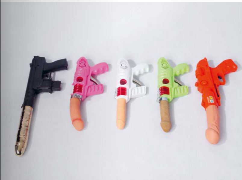
Esther Ferrer, Détournement de la pornographie au service de l'art : Jouets Educatifs , 1979-in progress, jouets et godemichets, dimensions variables. ©Esther Ferrer