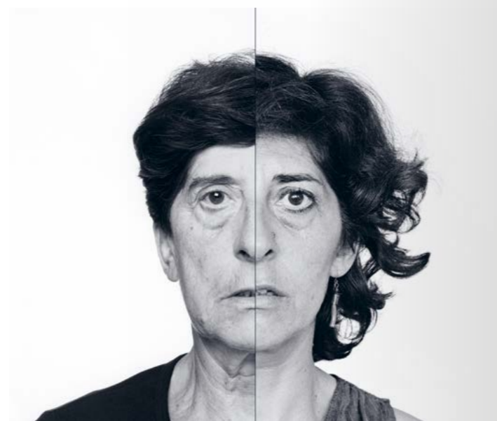
Esther Ferrer, Autoportrait dans le temps, 1981-2014. Tirage d'exposition. 20 x 25 cm.

Dans la série photographique, Esther Ferrer montre son pubis. Cette zone est habituellement taboue et invisible, l'artiste fait acte de féminisme en le manifestant. Par le dessin, la peinture et le collage, elle met en scène son propre corps. La feuille de vigne qui masque son pubis est une référence biblique : la chute d'Adam et Eve du paradis. Dans la religion catholique, Adam et Eve mangent le fruit de la connaissance. Alors qu'ils le croquent, ils prennent soudainement conscience de leur nudité et décident de la cacher sous une feuille de vigne. Eve, qui a été la première à le manger, sera jugée responsable. Cette rébellion provoquera leur expulsion du paradis. Eve est à l'origine de la première révolte féministe contre le patriarcat. Esther Ferrer est née dans une Espagne franquiste - dictature catholique patriarcale - puis a quitté son pays pour s'installer en France. Son œuvre est donc une critique de la religion catholique au sein de la civilisation occidentale qui oppresse les femmes et les diversités de genres.