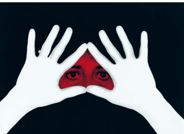
Esther Ferrer, série - Le livre des mains - Mains féministes , 2006, photographie à partir d'un original de 1977 - tirage travaillé à l'ordinateur, tirage exposition, 68 x 48 cm. ©Esther Ferrer

Comme d'autres femmes artistes à cette époque, elle cherche un moyen d'investir son corps dans sa pratique artistique. Le corps féminin, tant de fois objectifié par la vision masculine, est ici réapproprié d'une manière située.