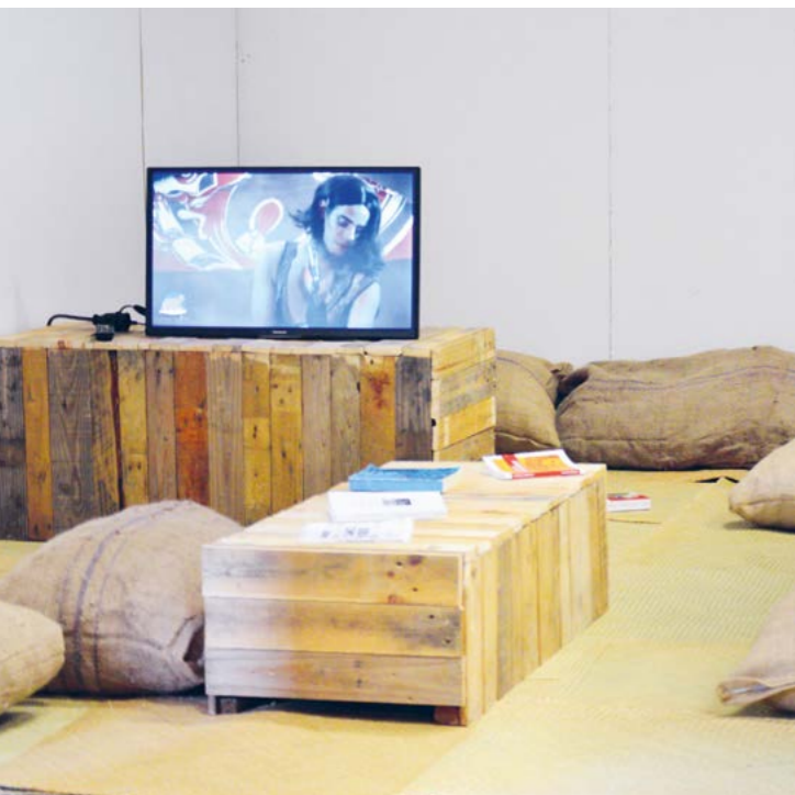
Brandon Gercara, Requeer, 2022, installation ronkozé, sézi, bois palette, goni, bâche, textes, livres, journaux, tablette, voix, dimensions variables. ©Ésa Réunion