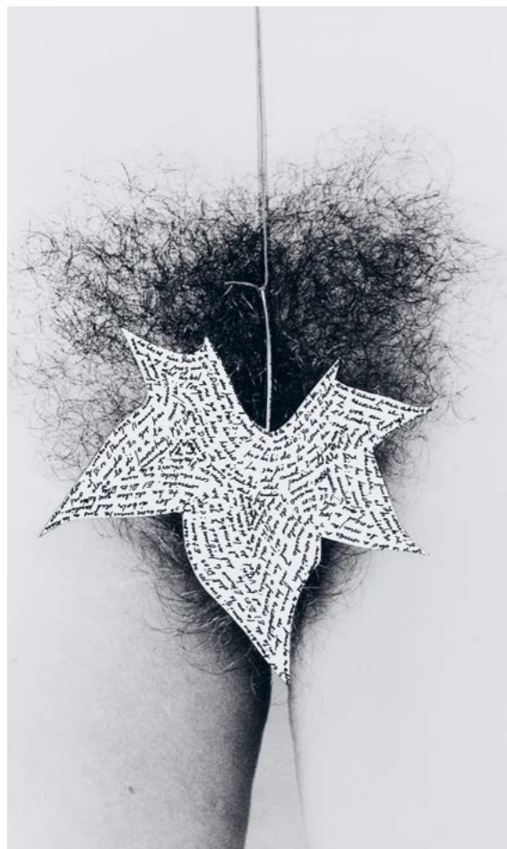
Esther Ferrer, série - Livre du sexe / Sexe avec feuille suspendue (blanche) avec écriture , 1987 tirage d'exposition, 72 x 90 cm. ©Esther Ferrer