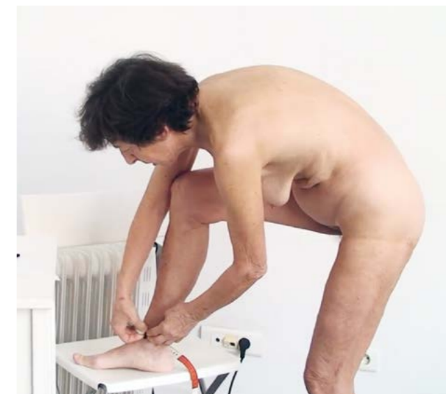
Esther Ferrer, Intime et personnel , 2013, vidéo, 39 min. ©Esther Ferrer

Esther Ferrer raconte dans une interview : « Cette idée, je l'ai eue pour la première fois en Espagne, à l'époque de la répression franquiste. J'étais dans une fête de village [...]. Soudain, j'ai vu un garde civil avancer et faire un geste agressif avec son fusil qui évoquait vraiment son phallus. Des années plus tard, j'ai acheté les jouets et des vibromasseurs pour faire ces pièces. » 3 Le geste violent du militaire, faisant l'analogie de son sexe et de son arme, a marqué Esther Ferrer, l'incitant à réaliser l'œuvre. Elle utilise d'une part des jouets d'enfants, et d'autre part des jouets d'adultes. Cette comparaison entre une arme (outil de guerre et de pouvoir) et le pénis (symbole du patriarcat et des violences sexuelles) crée un objet anti-phallogratique.