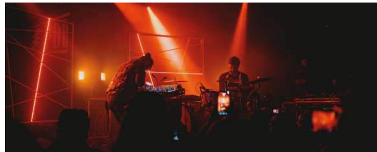
Double Vitrage, groupe sélectionné en 2025 sur la scène du Printemps de Bourges.

En Région Centre-Val de Loire vos antennes sont Antre Peaux (Bourges) et Le Temps Machine (Tours).