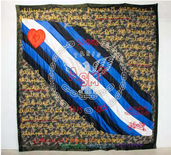
Sœurs de la perpétuelle indulgence, Patchwork des noms , patchwork, 3,56 m x 3,40 m, 2005

■ Conception d'un drapeau collectif : drapeau de la classe, de l'école... Inspiré du Patchwork des noms .