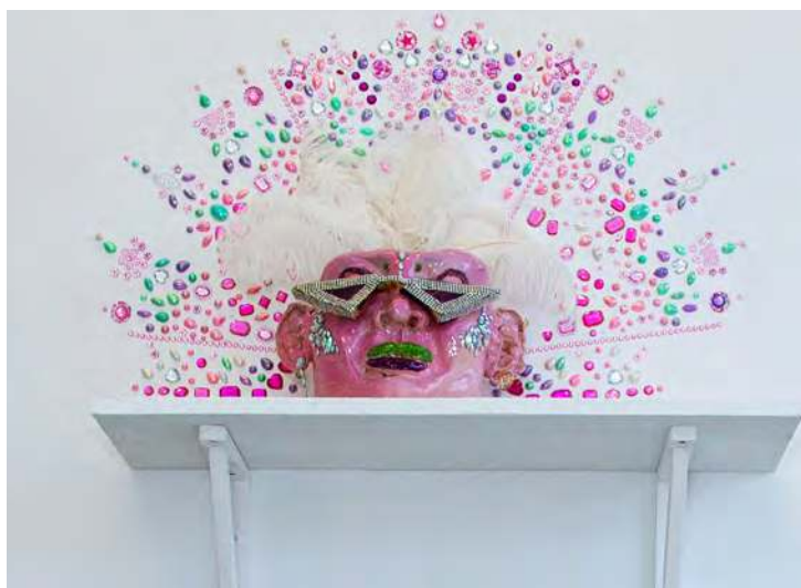
Jordan Røger, The House of Uranistas , céramiques émaillées et cuites, plantes, bijoux et faux diamants, dimensions variables, 2021.

Les médiateur·ices en arts visuels peuvent mettre à disposition de l'enseignant·e l'espace pédagogique et du matériel pour mener un atelier en autonomie. En fonction de l'atelier choisi et du matériel nécessaire, une contribution financière pourra vous être demandée.