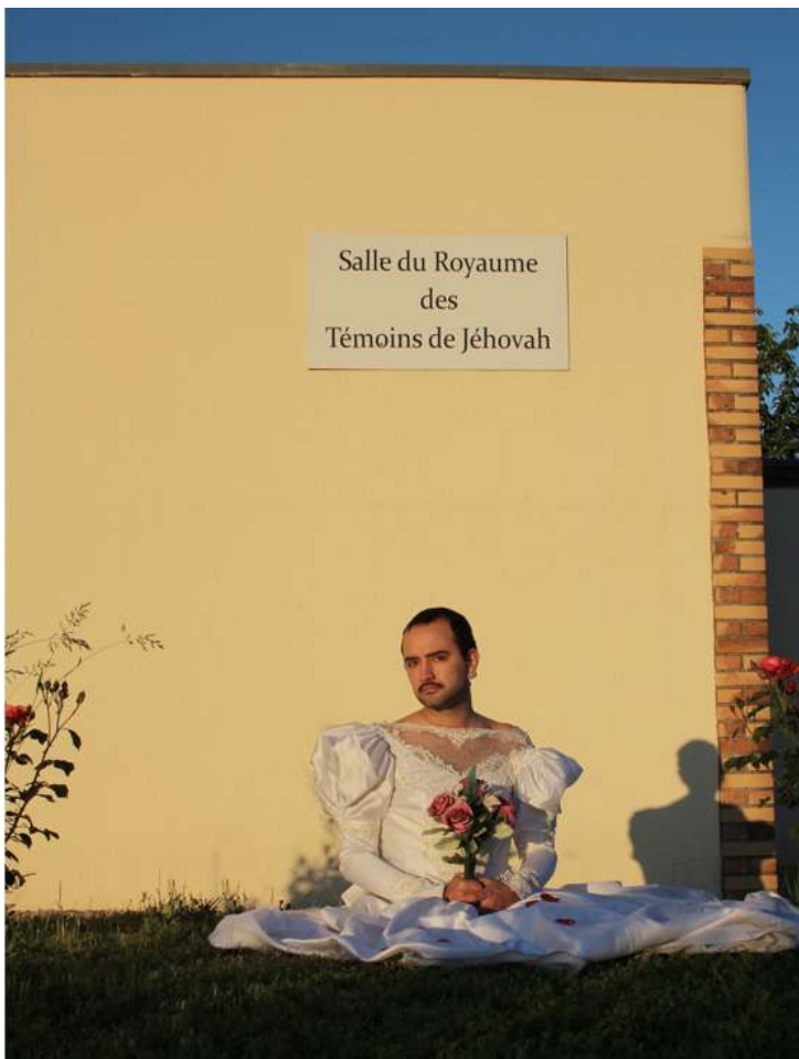
Jordan Roger, La Robe , photographie, 2 m x 1,33 m, 2020