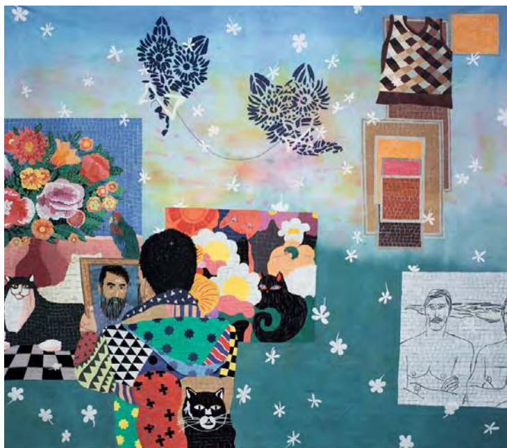
Chiachio & Giannone, Familia a seis colores , 2018 / 2021, série de mosaïques textiles, dimensions variables.

En s'inspirant des céramiques de Jordan Røger, les élèves seront invité·es à réfléchir aux questions de stéréotypes et d'expression de genre, ainsi qu'aux canons de beauté. Avec de l'argile ou de la pâte à modeler et des outils de modelage, iels seront invité·es à réaliser leur propre vase. Sequins, perles et autres éléments agrémenteront leurs productions.